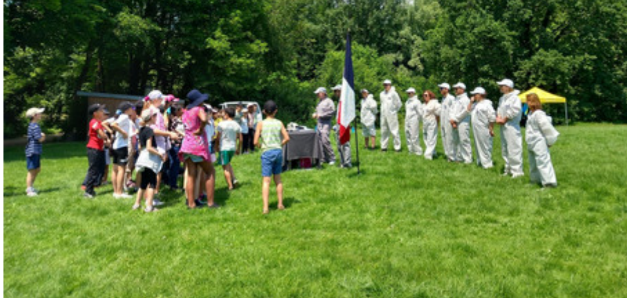
Grand jeu du Défi des Écoles - 6 juin 2023 au Parc de l'Île d'Amour

Découvrez les 18 projets pédagogiques d'éducation à l'environnement pour les écoles maternelles et élémentaires proposés par les associations environnementales et la Métropole pour l'année scolaire 2023/2024.