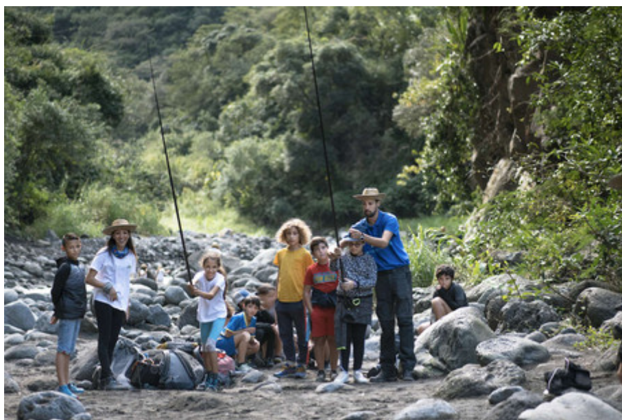
Aire éducative terrestre du Bras de la Plaine.

Faire évoluer les comportements, informer, sensibiliser... pour que chacun·e soit acteur·trice de la transition... Tels sont les enjeux de l'éducation à l'environnement et au développement durable. Sur le sujet, plusieurs appels à projets sont en cours. L'Office Français de la Biodiversité (OFB) vient de lancer un nouvel appel à projet pour les aires éducatives (petit territoire naturel géré de manière participative par les élèves d'une école ou d'un collège). Pour la cinquième année consécutive, la Dreal lance un appel à projets auprès des associations "Éducation à l'environnement, au développement durable et à la santé-environnement ».